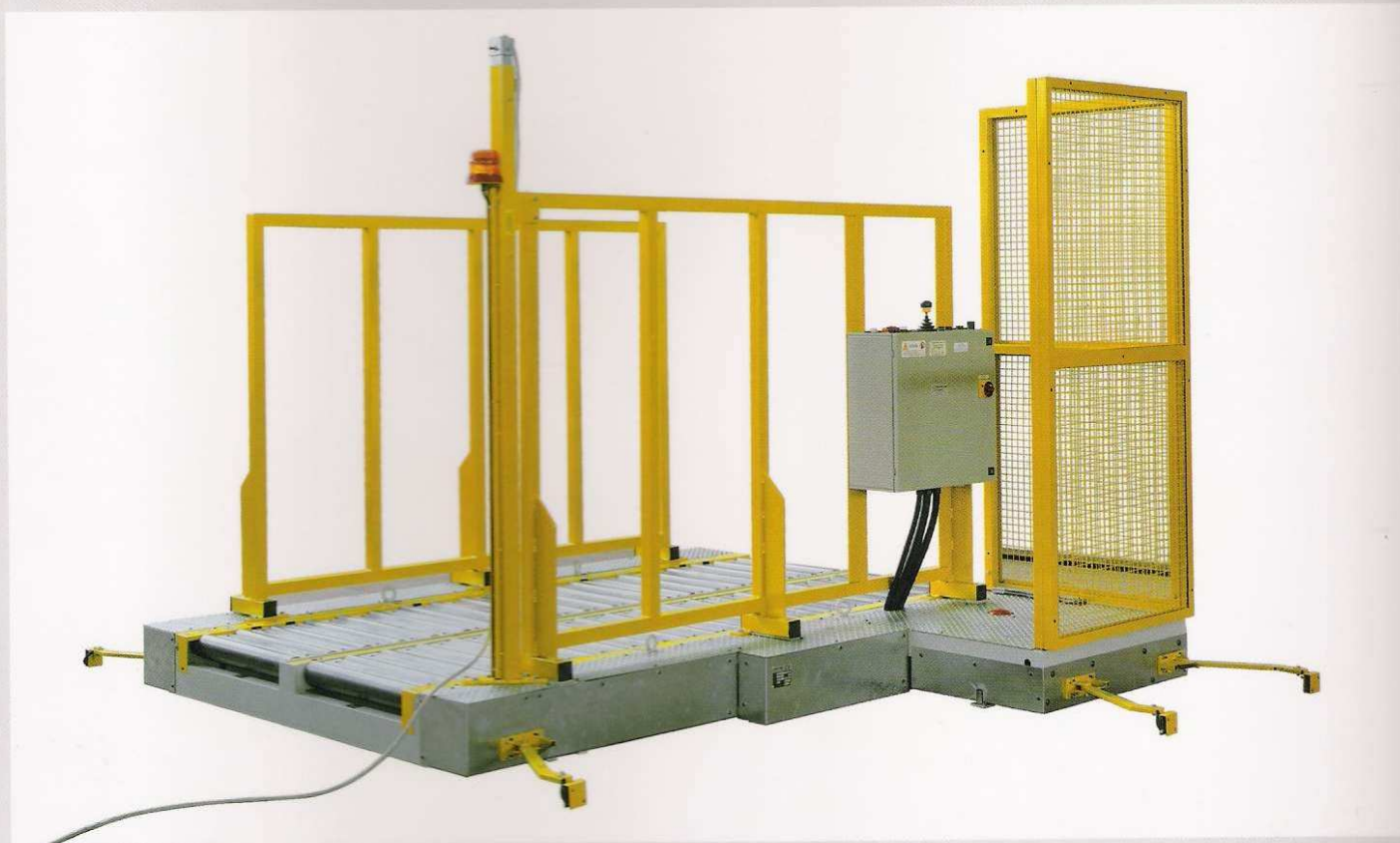
Navetta su binari a corrente alternata con operatore a bordo Shuttle on railway with alternating current, man aboard Chariot translateur sur voie avec alternatif courant, homme à bord