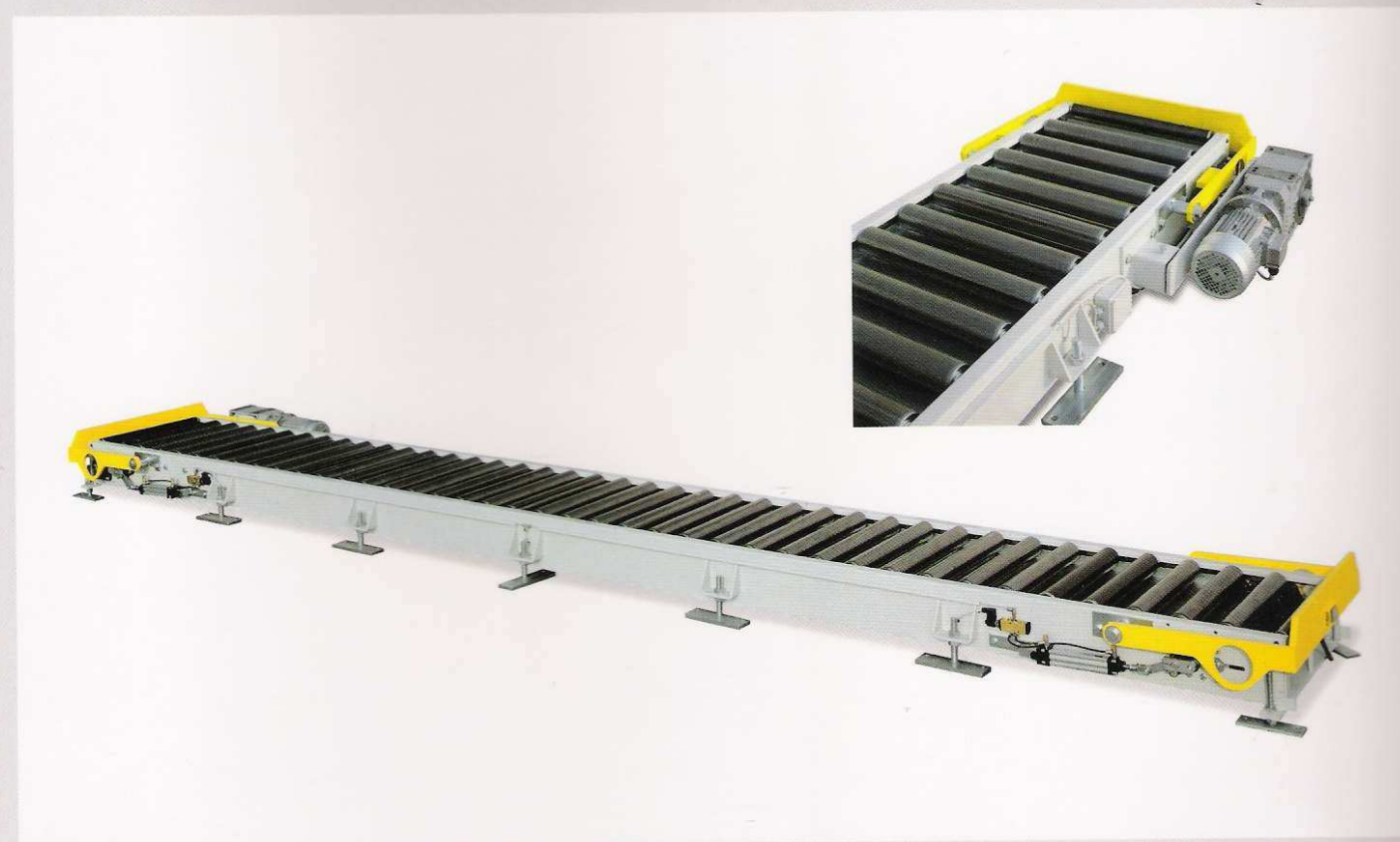
Sistema a tapparulli per accumulo con arresto pneumatico Accumulator rollers conveyor with pneumatic stop Système à rouleaux pour accumulation avec arrêt pneumatique