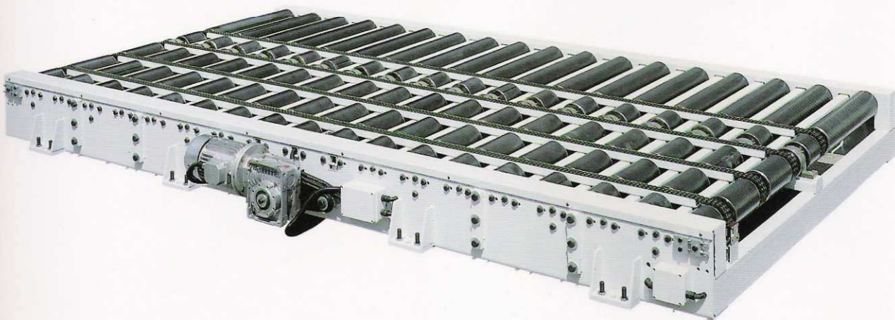
Trasportatore a rulli e catene Rollers and chains conveyor Transporteur à rouleaux et chaînes