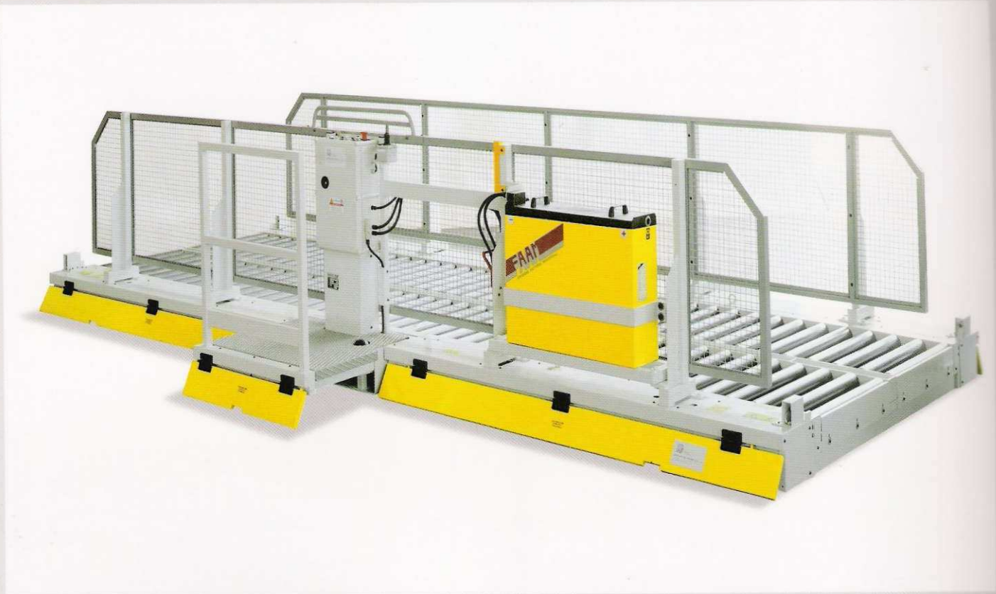
Navetta su binari alimentata a batteria Shuttle on railway with battery supply Chariot translateur sur voie avec alimentation à batterie