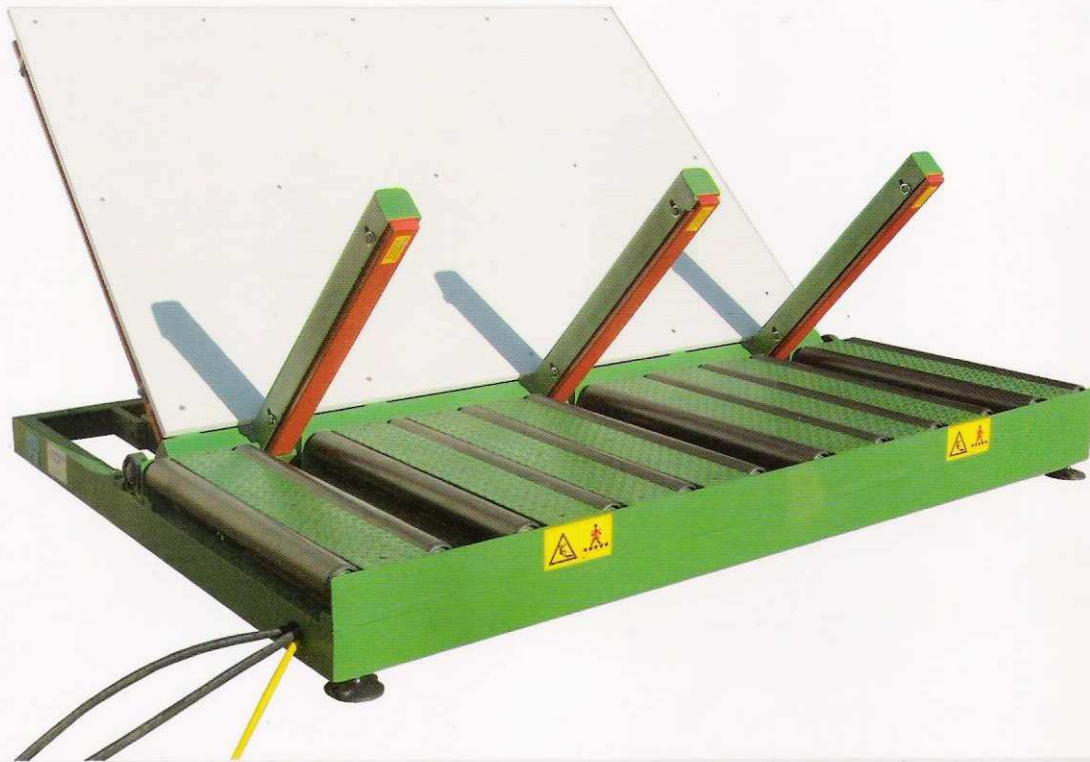
Ribaltatore Turning station Installation de retournement