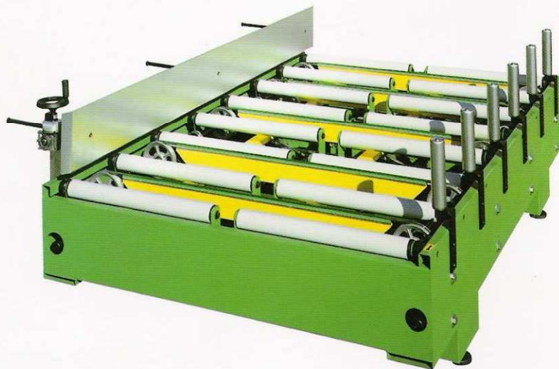
Trasportatore a rulli e cinghie Rollers and little belts conveyor Transporteur à rouleaux et petits bandes