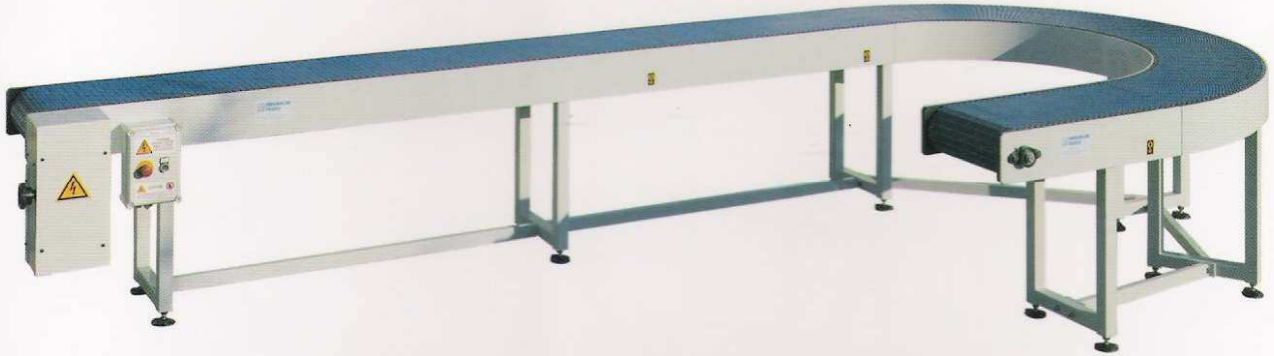
Trasportatore a nastro modulare a 90° Modular belt conveyor Transporteur à bande modulaire à 90°