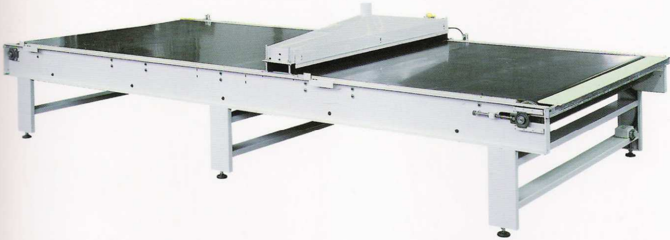
Trasportatore a nastro Belt conveyor Transporteur à bande